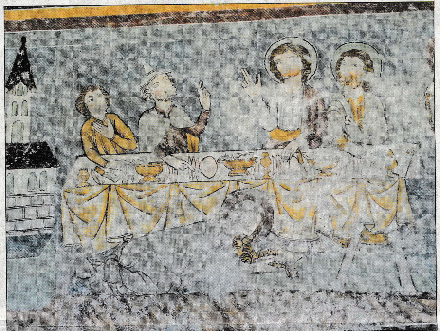
Igl savund maletg mussa Maria Madlagna lavànd ad unshànd igls pes da Jesus, a Judas Iscariot c'admunescha c'ella sfarlàti igl ieli custevel.