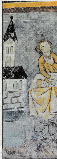
Igl savund maletg mussa Judas Iscariot c'admunescha.