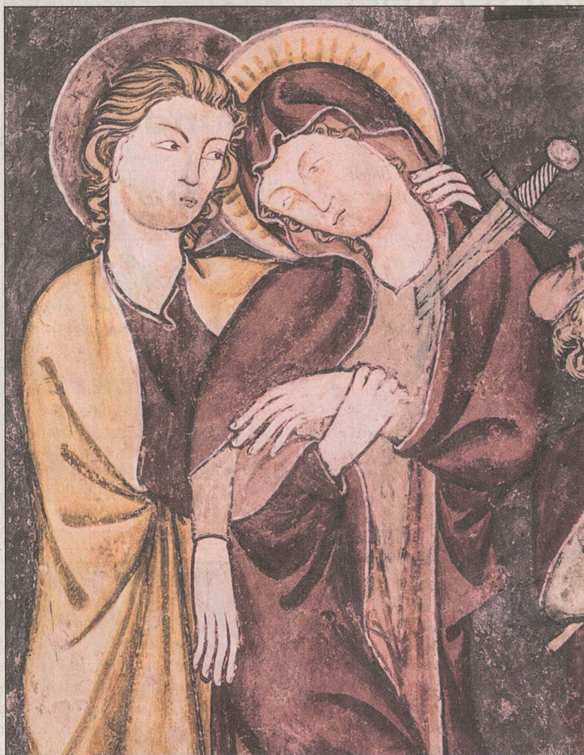
Il «Meister da Vuorz» ha creau avon rodund 700 onns el Grischun rodund 20 maletgs en differents loghens.