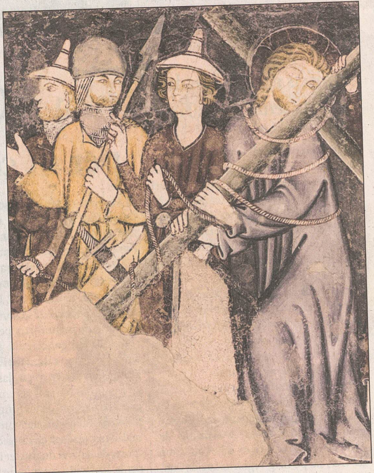
Ina dallas bellezia ovras dil «Meister da Vuorz».

■ En plirs loghens dil cantun Gri- schun pon ins contemplar ovras d'in artist nunenconuscent. Usa dedichescha Vuorz in museum a quei um che ha viviu avon ro- dond 700 onns. A Vuorz eis el num- nadamein era staus activs. Ella ba- selgia sesanflan pliras ovras e quellas vegnan giudicadas dils specialists digl art per las meglieras da quei pictur-artist. Leutier ein ellas – sco biaras autras ovras dad el en auters loghens – semantenidas fetg bein. Tut en tut dattan oz aunc rodond 20 picturas dad el perdetga da sia lavor el cantun Grischun. Ella Casa Cadruvi che sesanfla ella vischinon- za dalla baselgia vegnan duas stan- zas dedicadas al «Meister da Vuorz». Cheu vegn informau egl avegnir davart quei artist che fascinescha aunc oz, denter auter co e nua ch'el ha luvrau. L'avertura dil museum ha liug dumengia proxima. Guido Dietrich digl Arcun da tradiziun da Vuorz ei perschuadius che la lavor digl artist plidenta bia glieud.